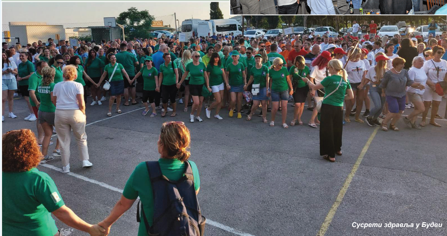
Сусрети здравља у Будви