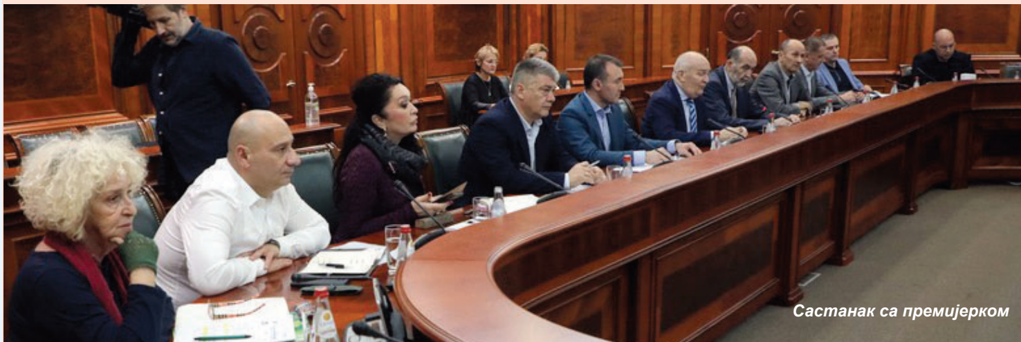
Састанак са премијерком

Такође, Брнабић је истакла да ће се лично заложити да министри буду присутни и активни учесници на седницама Социјално економског савета, како би рад тог тела био ефикаснији.