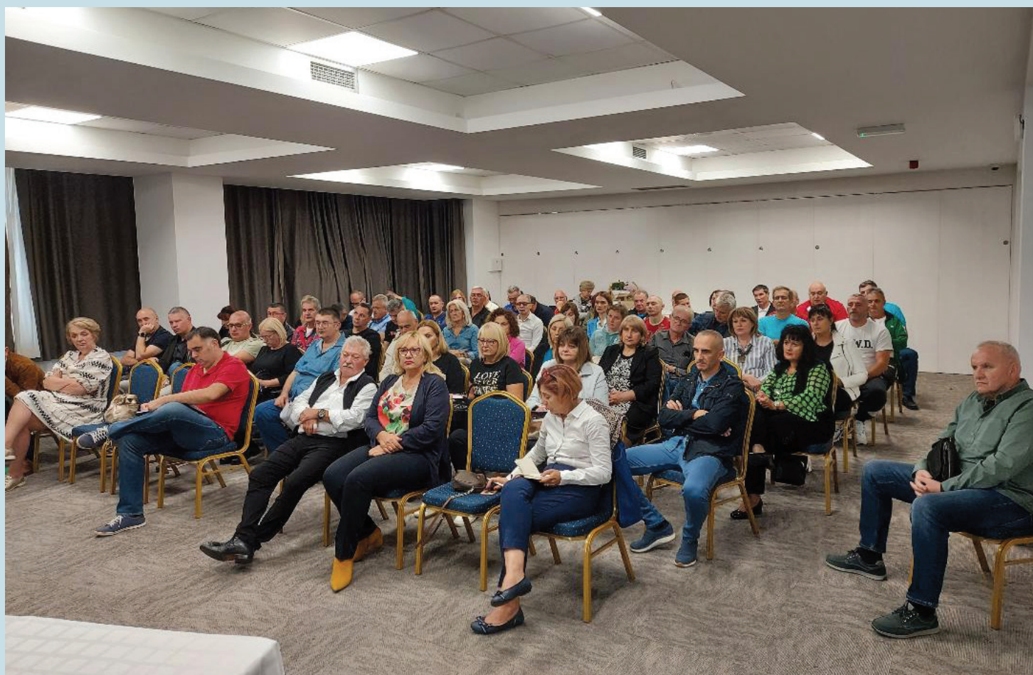
Седница РОС одржана 14.10.2022. године

Републички одбор је донео одлуку о именовању чланова преговарачког тима за закључивање ПКУ за делатност здравства, као и чланова Комисије за праћење примене