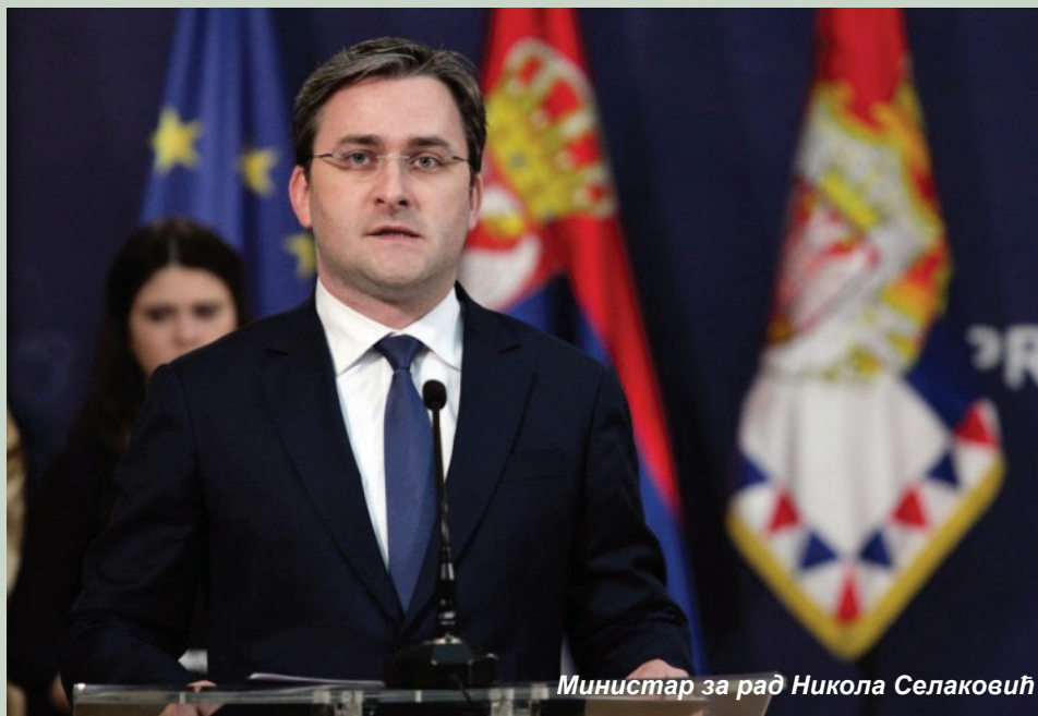
Министар за рад Никола Селаковић

Имајући у виду комплексност преговора и значај Посебног колективног уговора, предлажемо да са преговорима кренемо што пре, како би на