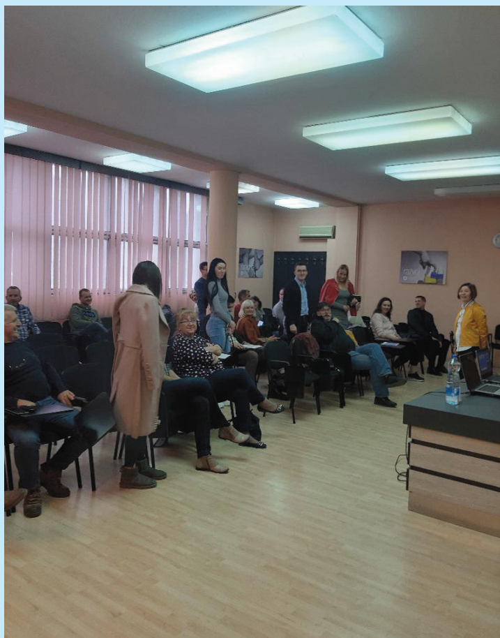
Семинар Севернобачки округ

Синдикат запослених у здравству и социјалној заштити Севернобачког округа