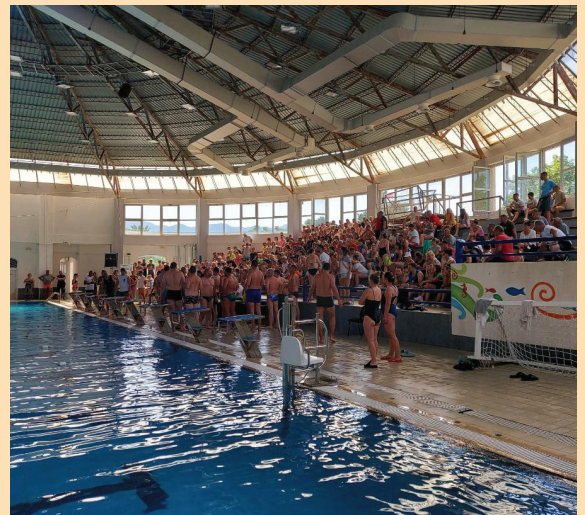
Публика на такмичењу у пливању