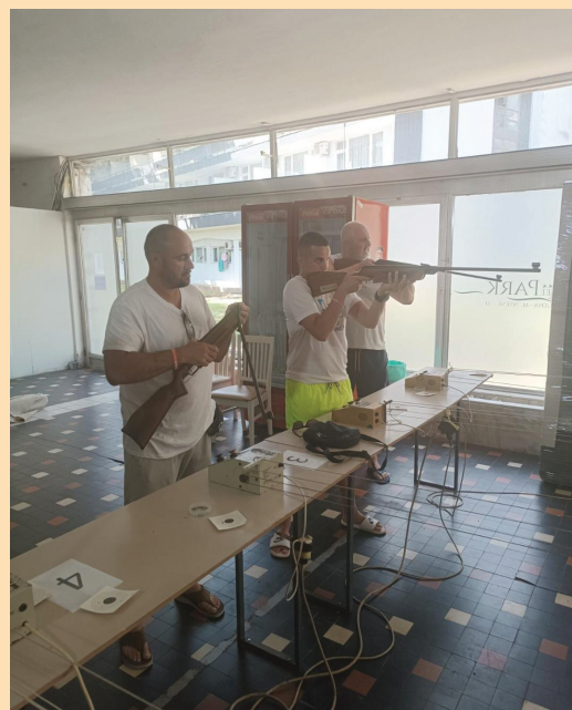
Стрељаштво екипа Јабланичког округа