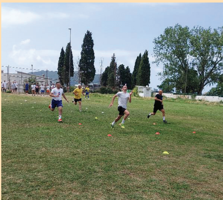
Такмичење у трчању