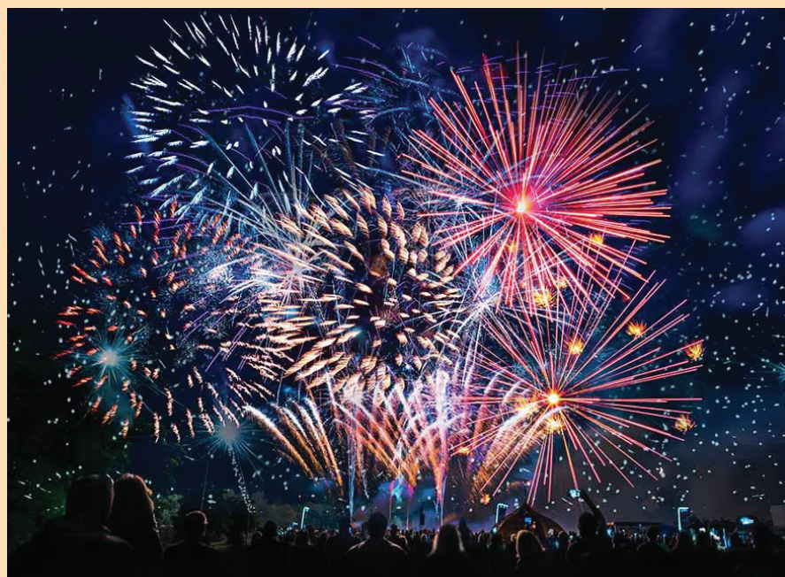
Ватромет на затварању Сусрета здравља