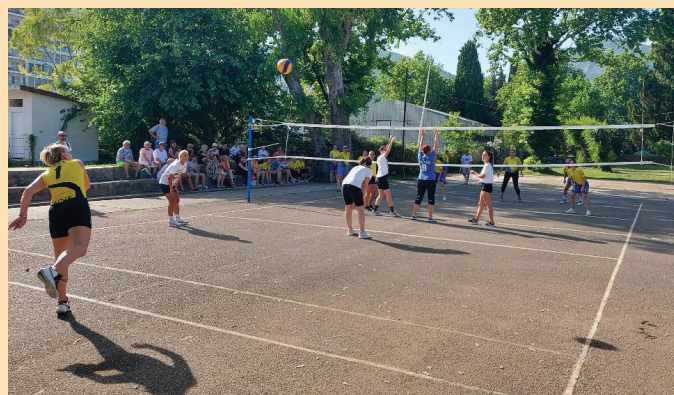
Одбојка за жене