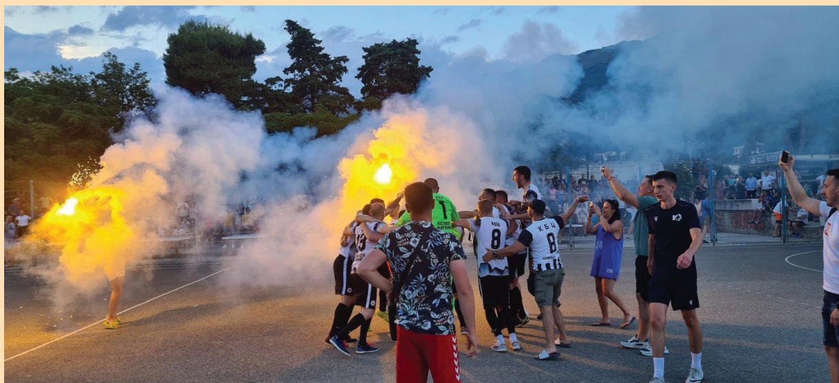
Екипа Косовскомитровачког округа славе