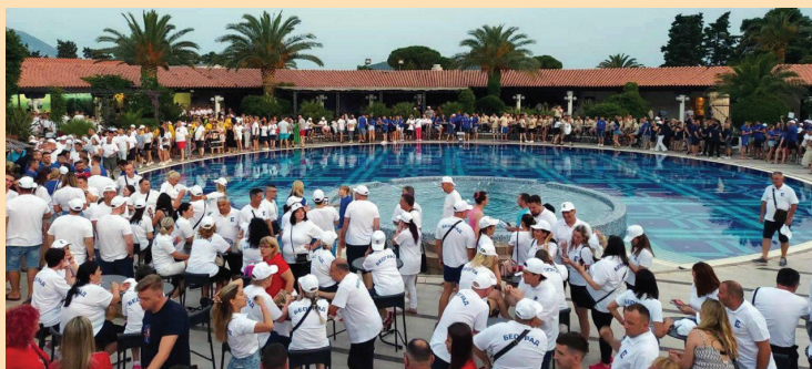
Детаљ са отварања 28. Сусрета здравља