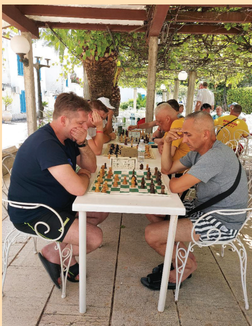
Шах Косовскомитровачки-Браничевски округ