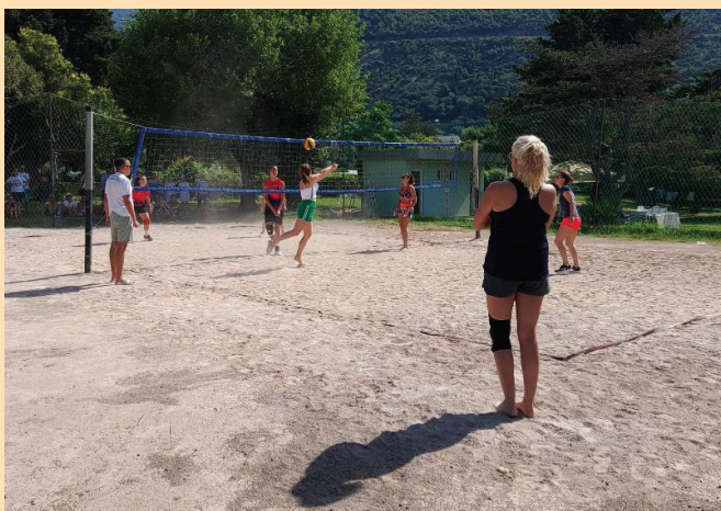
Одбојка на песку