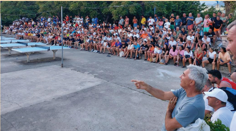
Публика на малом фудбалу