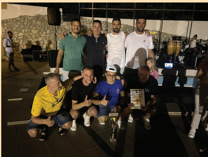
Екипа Јужнобанатског округа кошаркаши