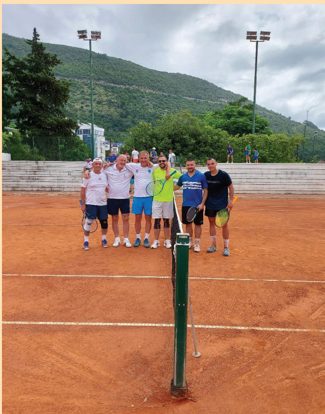
Тенисери Јужнобанатског и Колубарског округа