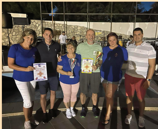
Екипа Јужнобанатског округа стонотенисери