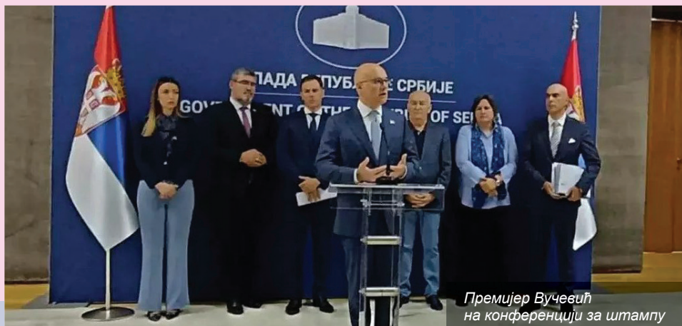
Премијер Вучевић на конференцији за штампу