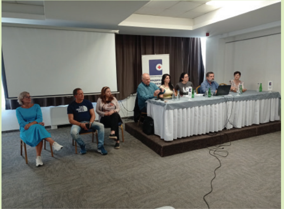
Чланови органа ПОС-а и чланови одбора синдикалних организација на 23. седници ПОС-а и семинару у организацији Синдиката запослених у здравству и социјалној заштити Војводине

Трећег дана семинара, предавање из области безбедности здравља на раду, одржао је проф. Бела Про-