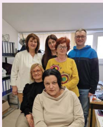
Рачуноводство општинског Дома здравља Пландиште