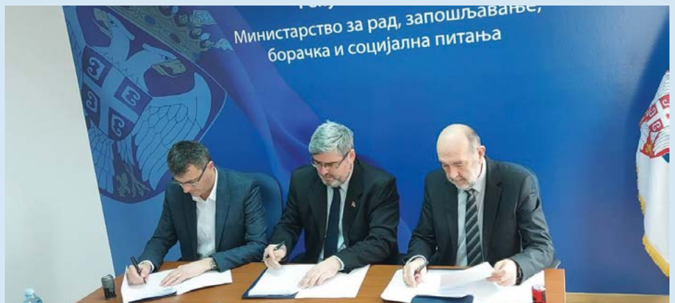
Потписивање Протокола за делатност социјалне заштите