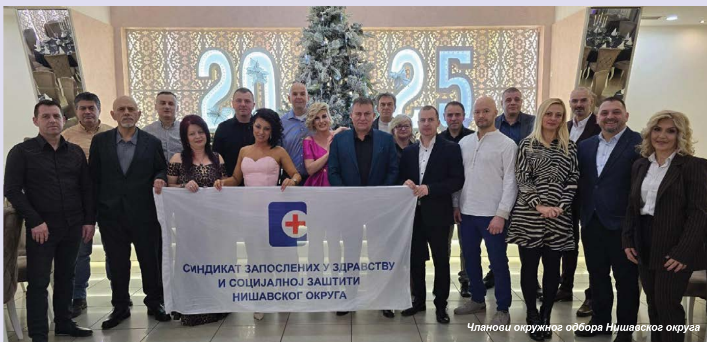
Чланови окружног одбора Нишавског округа

Треба посебно нагласити да смо сарадњу са Републичким одбором синдиката подigli на највиши могући ниво и захваљујући томе издејствовали код послодавца велики број припадајућих права из ПКУ, Закона о раду и Закона о здравственој заштити што је један од приоритета нашег синдикалног рада. Трудимо се да финансијски помогнемо нашим члановима у свим важним животним догађајима (рођење детета, смрт