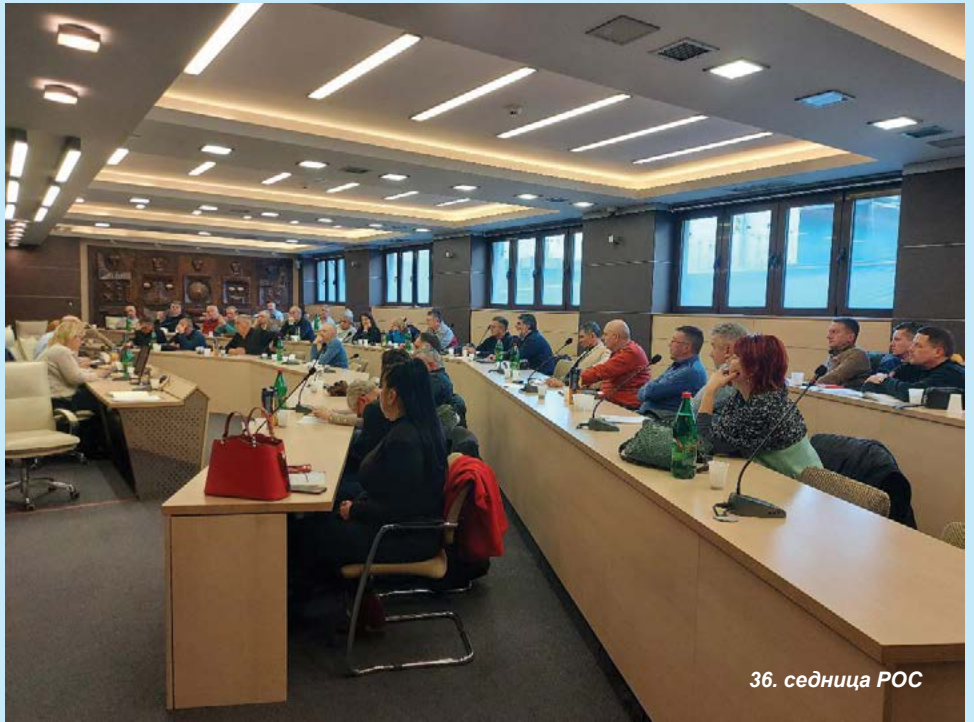
36. седница РОС

Истакнуто је да постоји огромно незадовољство запослених административних радника и у вези са тим РОС је једногласно донео Одлуку да се упути допис чланству, у смислу да овај кадар није