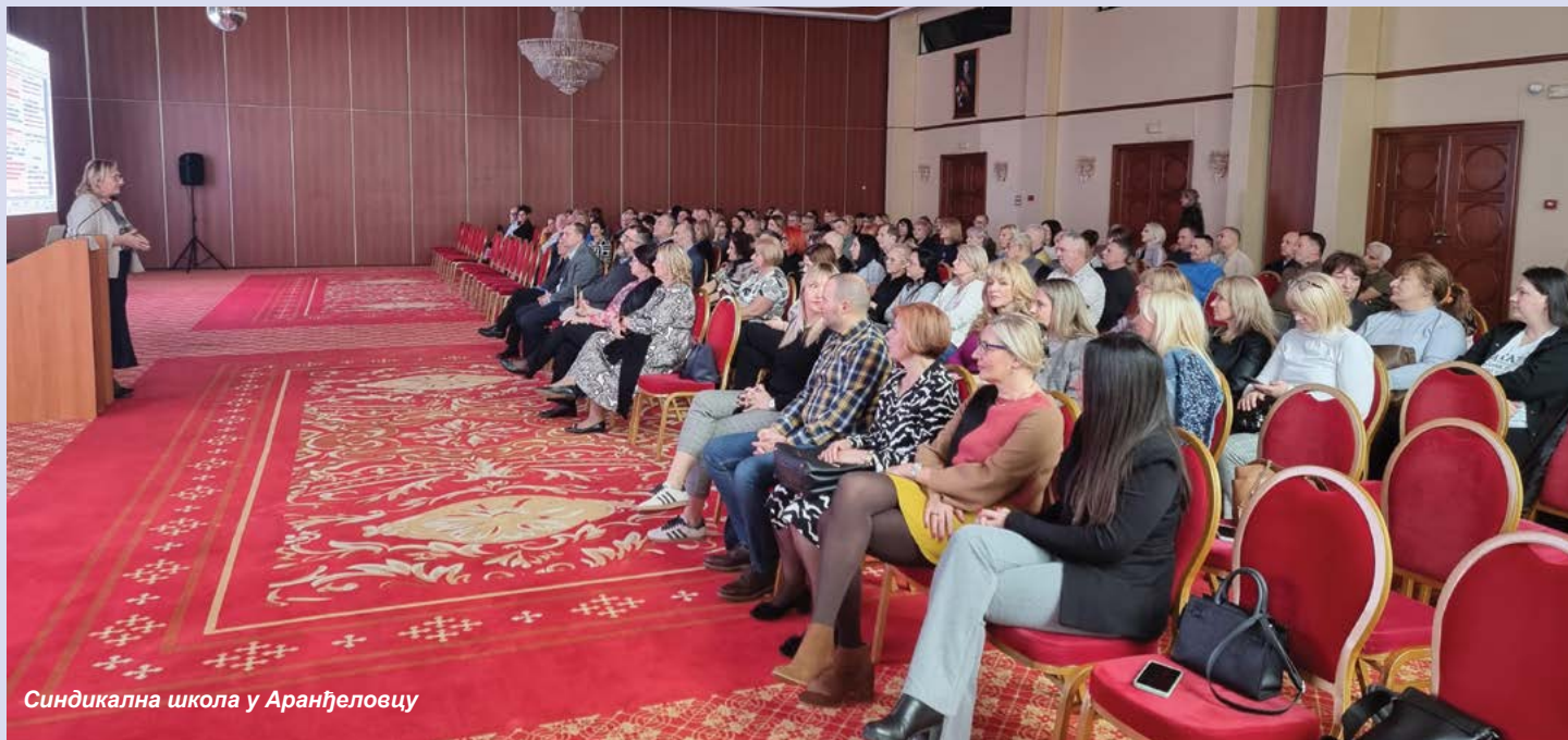
Синдикална школа у Аранђеловцу