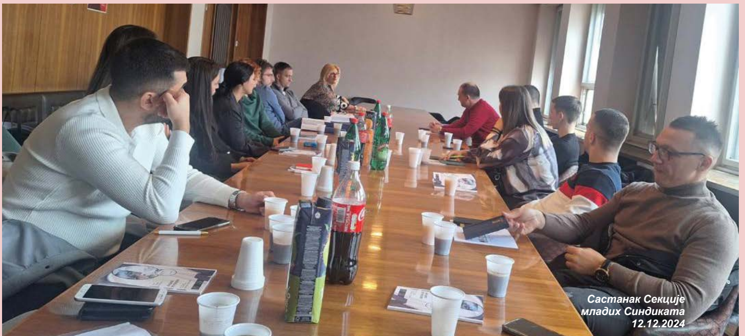
Састанак Секције младих Синдиката 12.12.2024